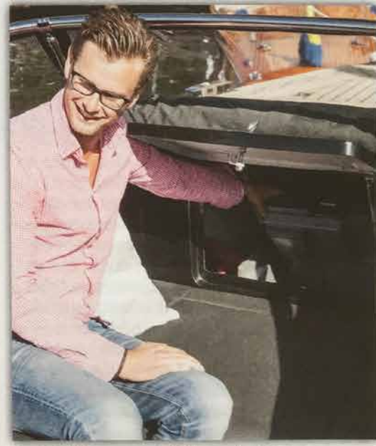
En riktig "champagnejolle" har naturligtvis en vinkyl i stuvluckan i fören.