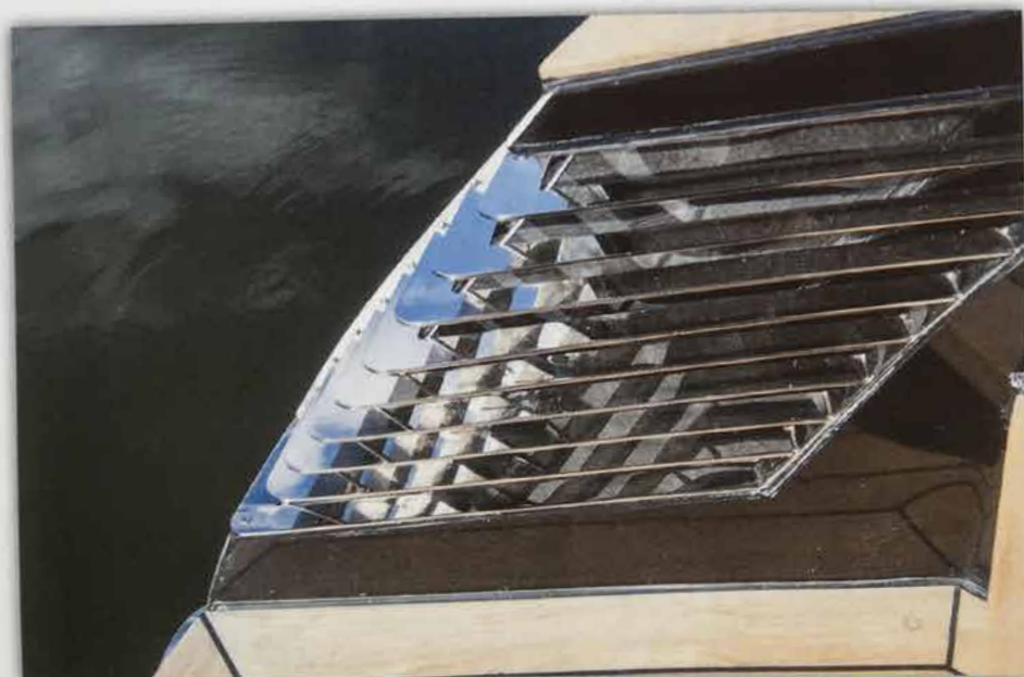
Ventilationen till stuvluckan i aktern påminner om en gammal fin jänkarbil.

Grundpriset för 777:an med en 27- eller 29-hästares Yanmar-motor är 479 000 kro-