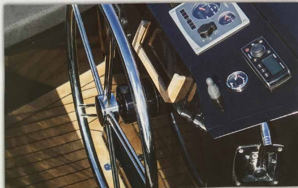
Styrpulpeten är snygg med stor ratt, men plotter är inte standard och pulpeten sitter bara fast i däck med två små gångjärn.

Lådan som döljer motorn fungerar även som en styrpulp. Den står inte helt fast på däck, vilket inte är så bra om det skulle bli tuffa tag, men en picknick i lugnt väder klarar den garanterat. En annan nackdel är att många grejor som svenska båtägare gärna vill ha inte ingår som standard. Plotter, badstege, bränslemätare är tillval, men det är kanske inte så nödvändiga prylar på en holländsk kanal.