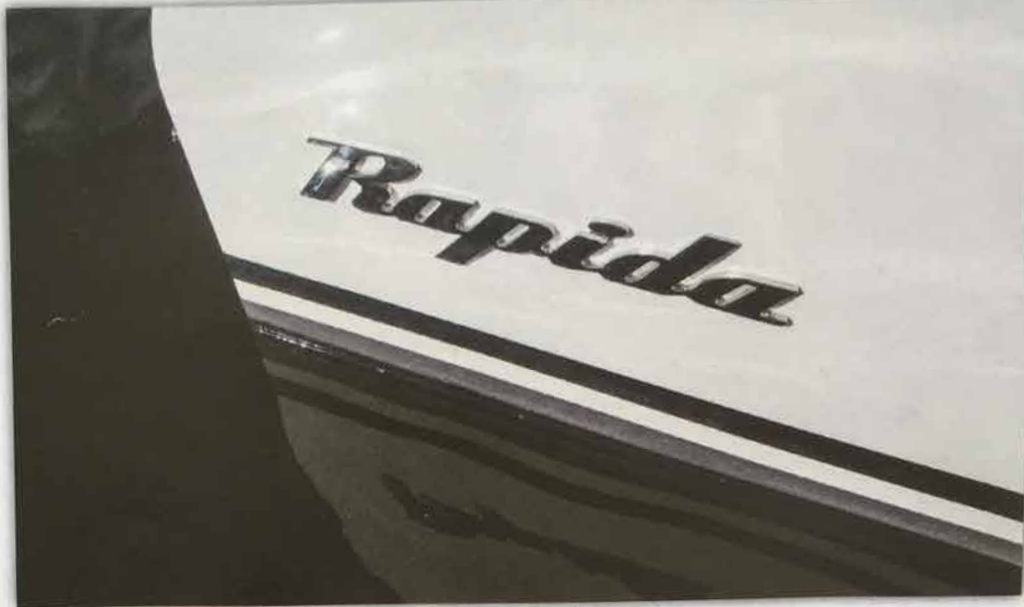
Rapida 777 har en lyxig karaktär som påminner om en modern tender.

H olländarna kan det här med kanalbåtar och socialt umgänge. Varvets namn Isloop betyder kanalsnipa, och visst låter det lockande. Men kan det konkurrera med de svenska motorsniporna, som har så mycket träbåtstradition att till och med sillen blir glad av att komma ombord?