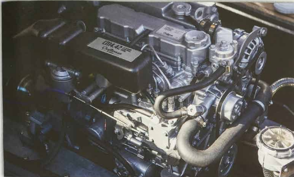
En Craftman-diesel på 42 hästar ger en marschfart på 8–9 knop med human bränsleförbrukning på 0,35 liter per sjömil.

nor. För 555 000 kr ingår Craftman-diesel på 42 hästar, ljudsystem, plotter, flexibelt kappell med tvådelad sprayhood, bränslemätare, bogpropeller och extra solbädd med aluprofil i fören.