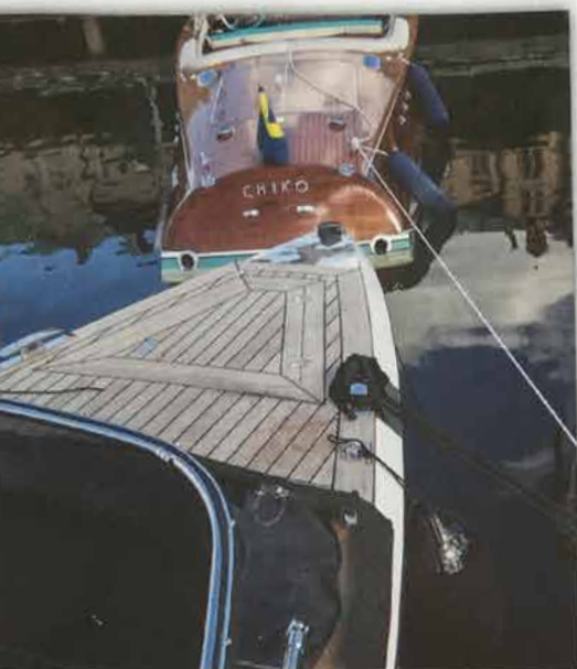
777:an ser lika sportig ut som en Riva, men fart-resurserna är betydligt blygsammare.