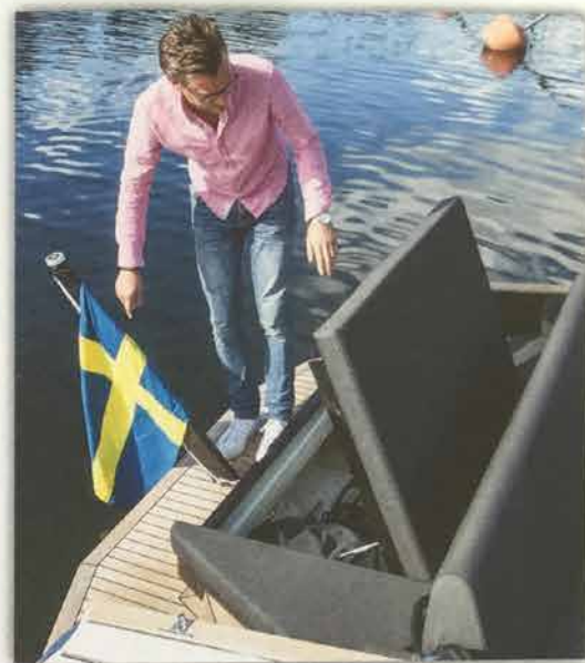
Solsoffan i aktern har flyttbart ryggstöd som fälls upp för att komma åt det stora stuvfacket inunder.

Rapida 777 är ingen båt för tuffa väder, men när Praktiskt Båtägande testade den klöv den spetsiga fören högt svall från en passagerarbåt förvånansvärt bra och båten krängde knappt. Botten är ganska plan med undantag av en liten kölprofil i aktern som skyddar propellern. Den relativt höga vikten, 1 550 kilo i den version vi testade, inne-